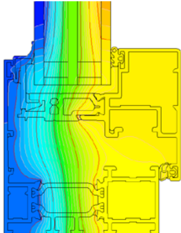
przykładowy rozkład izoterm dla systemu Ecofuturał OC (EF214 + EF222)